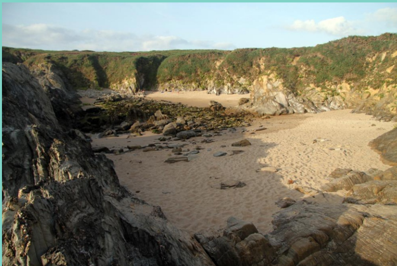
Praia do Rego