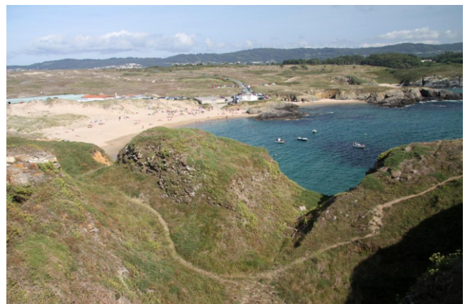
Praia da Mourella ou dos Botes