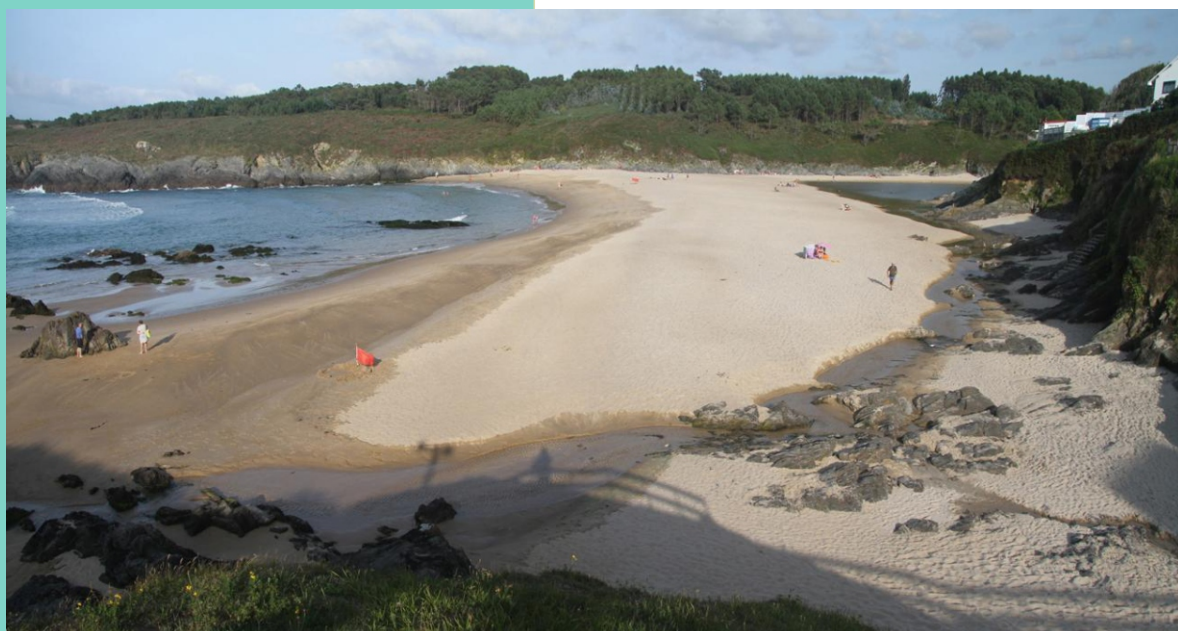
Praia de Meirás ou Do Río