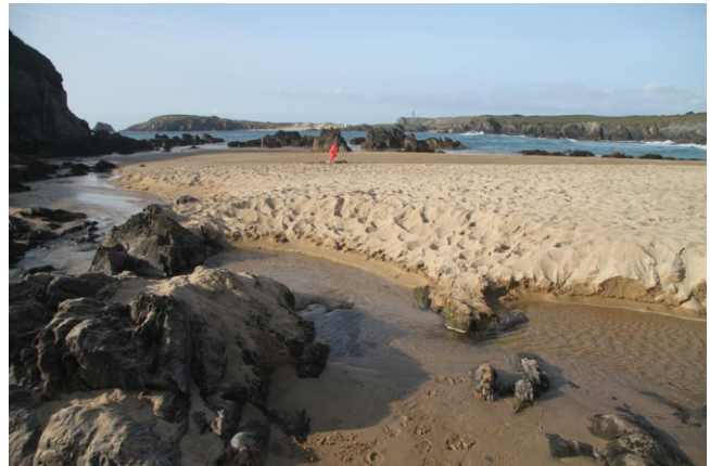
Praia do Río