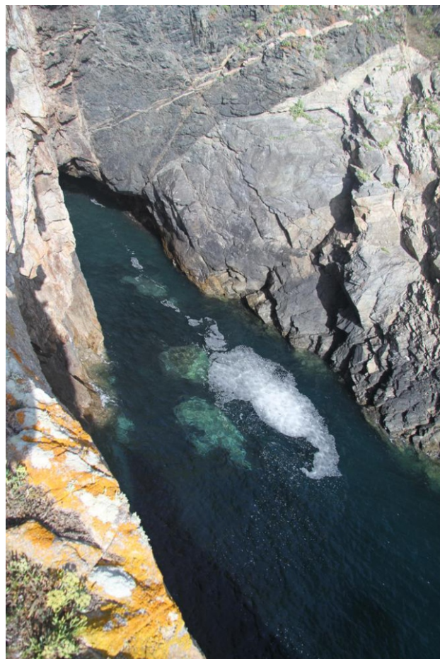
Punta do Portiño

A costa de Valdoviño está incluída no LIC/ZEC "Costa Ártabra".