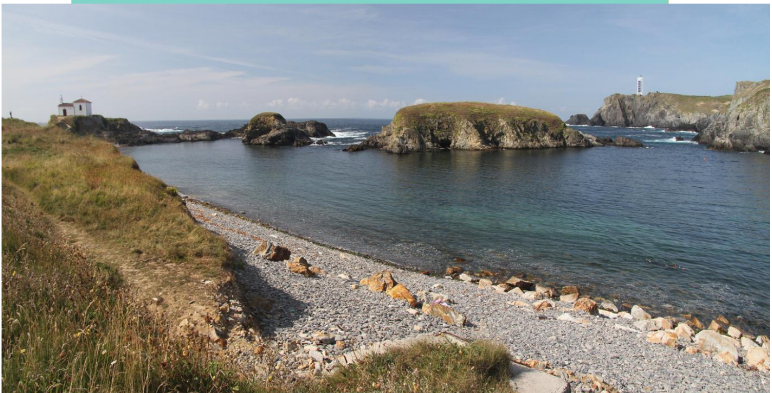
Cala do Porto e illa Herbosa