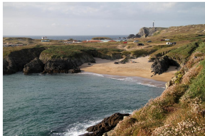
Praia do Cano Grande