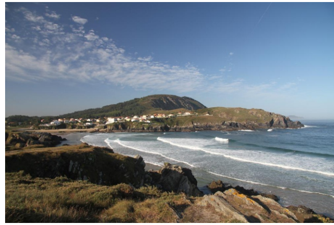
Praia de Meirás e Punta Bieiteiro