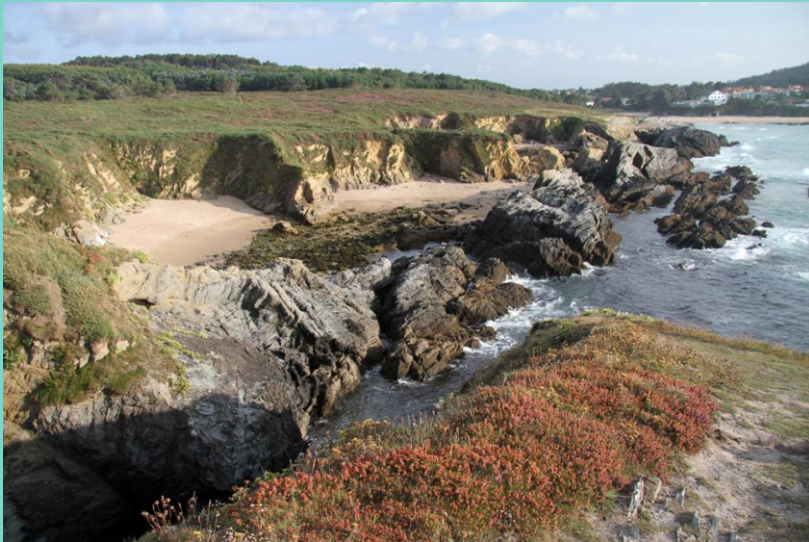
Praia do Cortello

O percorrido de ida e volta podemos comezalo en calquera punto. Comezando na praia do Río facemos un percorrido por ela pola beira do rego que desemboca nela e subimos polas escaleiras que hai ao fondo para seguir pola estrada. No enlace collemos á esquerda e seguimos ata o enlace seguinte onde volvemos a ir á esquerda para achegarnos ao mar. No remate da estrada collemos á dereita para beirar a praia do Cano Grande antes de chegar ao aparcadoiro da praia dos Botes, alí cruzamos cara á piscifactoría, rodeámola para acceder á praia do Porto , de coios, pero moi tranquila e ben protexida por varias rochas e os illotes Herbosa e a da Capela enriba da que se atopa a ermida da Virxe do Porto . Continuamos o percorrido polo perímetro da punta par ver os seus recantos, o illote do Castelo e a pegada de varios puntos de extracción de minerais antes de baixar á praia da Mourella ou dos Botes (porque tamén serve de refuxio a pequenas embarcacións), pasamos dela a do Cano Grande e volvemos á estrada, pero esta volta non imos a seguila senon que continuaremos polo camiño da beira que vai ás praias do Cortello e do Rego recollidas, excavadas nos cantís e protexidas por grandes rochas. No remate do camiño, pasadas as praias, hai un carreiro que, se a marea está baixa permite que baixemos polas pedras, á praia do Río e completemos o percorrido.