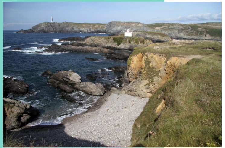
Costa do Portiño e Ermida da Nosa Sra. do Mar